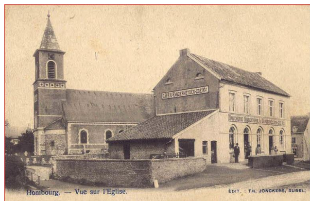
L'école communale de 1852 à 1870

L'école unique fut déplacée de « La Bach » et trouva un local convenable à la maison communale (photo-ci-dessous)